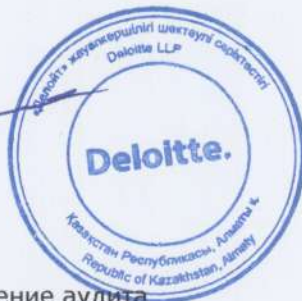
Нурлан Бекенов Генеральный директор ТОО «Делойт» Лицензия с правом на проведение аудита по Республике Казахстан №0000015, вид МФЮ - 2, выданная Министерством финансов Республики Казахстан от 13 сентября 2006 г.